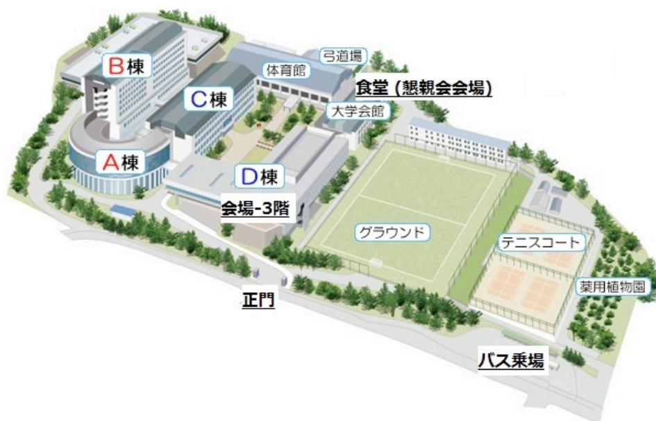
[キャンパスマップ]

会場は正門を入ってすぐ左手にある D 棟の 3 階-D302 講義室です。受付は D302 講義室前に設置しております。懇親会会場は D 棟に隣接する大学会館 1 階の学生食堂で行います。昼食は食堂 (懇親会会場) をご利用下さい。また D 棟 1 階にはコンビニエンスストアがあります。